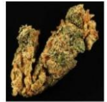
▲ Alerte: cannabi... 5F-MDMB-PICA 06.10.2020