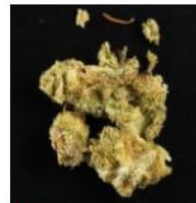
▲ Alerte: Cannabi... 5CI-ADB-A 10.07.2020

Das aktuell auf dem illegalen Markt in der Schweiz verkaufte Cannabis enthält regelmässig synthetische Cannabinoide, die zu einer tödlichen Überdosis führen können. Es ist unmöglich, dieses Gras mit blossem Auge oder aufgrund des Geruches oder des Geschmacks von Cannabis mit einem hohen THC-Gehalt zu unterscheiden.